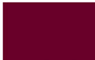
ROW HOUSE RED ROUGE AUVENT

Faites des tests de couleur à l'aide d'une petite planche peinte. Appuyez la planche échantillon contre un mur et collez-y un meuble de la pièce. Vous verrez alors comment s'agence la peinture avec vos planchers et meubles.